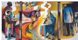
Epiphanie par Arcabas

Sois Celle qui chez moi reçoit. Afin que ceux qui ont besoin D'être réconfortés le soient ; Ceux qui ont le désir de rendre grâce Puissent le faire ; Ceux qui cherchent la paix, la trouvent. Et que chacun reparte vers sa propre maison Avec la joie d'avoir rencontré Jésus lui-même, Lui, le chemin, la vérité, la vie.